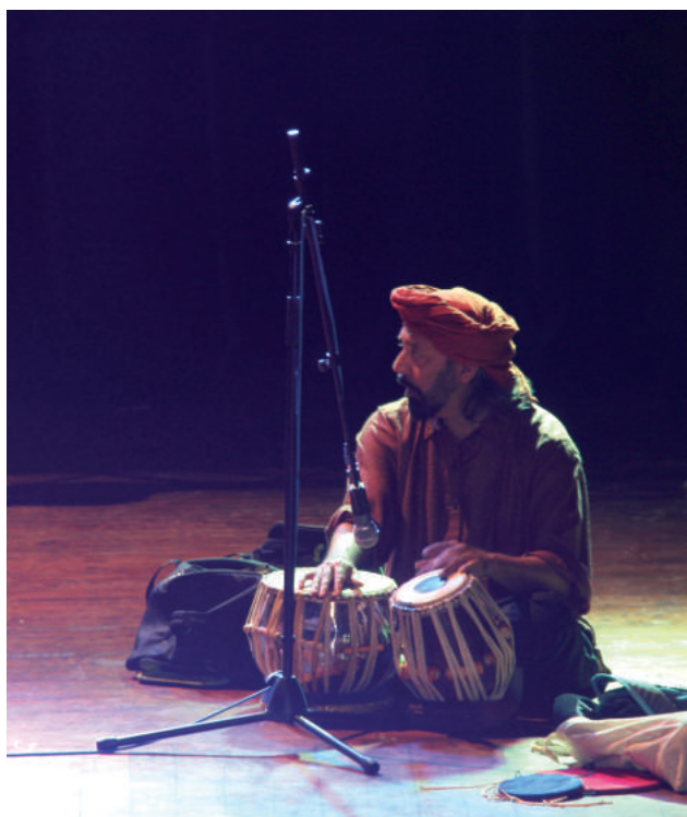
Festival Universitaire du Patrimoine des Civilisations