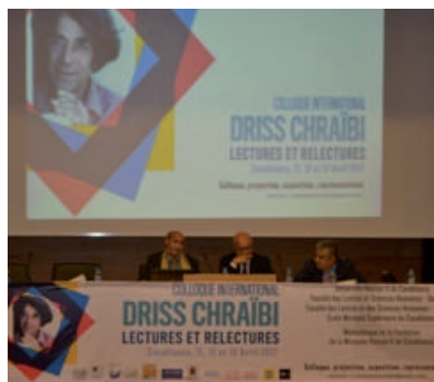
Lectures et relectures de Driss Chraïbi"