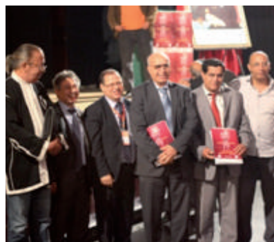
Festival International Art et vidéo