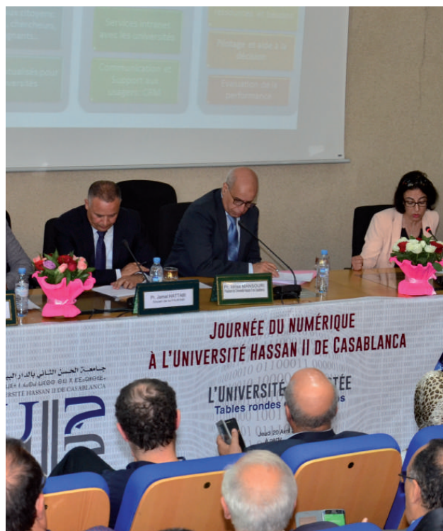
Journée du Numérique 'L'UNIVERSITÉ CONNECTÉ'