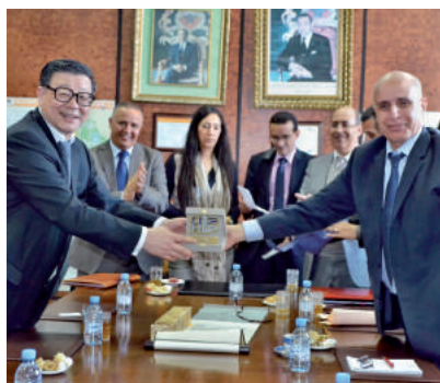
Visite de la délégation Chinoise