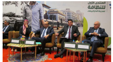
المنتدى الأول للنيقابة لمدينة الدار البيضاء