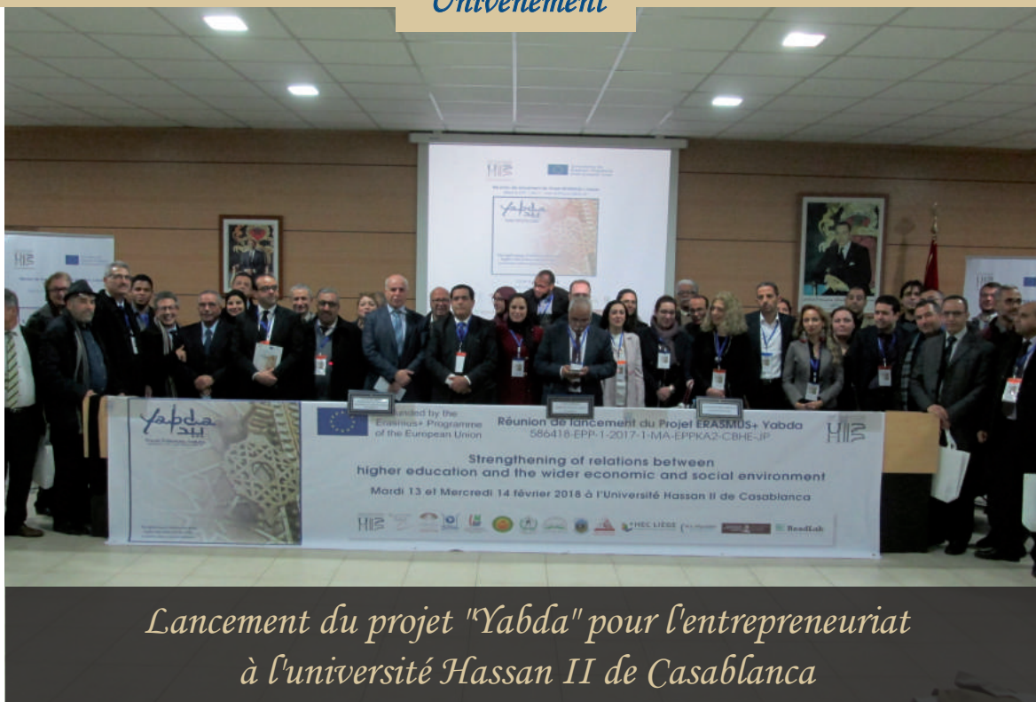
Lancement du projet "Yabda" pour l'entrepreneuriat à l'université Hassan II de Casablanca

L'Université Hassan II de Casablanca a lancé, mardi 13 Février 2018, le projet Yabda qui a pour objet le renforcement des relations entre les établissements de l'enseignement supérieur et le milieu socio-économique. Ce projet s'inscrit dans le cadre du programme Erasmus+ financé par l'Union Européenne.