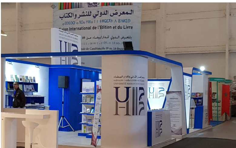
L'Université Hassan II de Casablanca au Salon International de l'Édition et du Livre