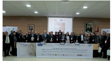
Lancement du projet "Yabda" pour l'entrepreneuriat à l'université Hassan II de Casablanca