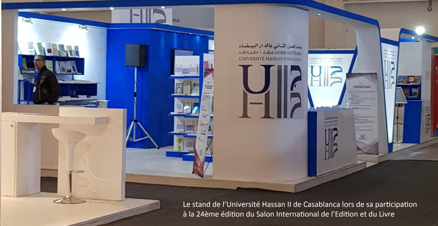
Le stand de l'Université Hassan II de Casablanca lors de sa participation à la 24ème édition du Salon International de l'Édition et du Livre

جامعة الحسن الثاني بالدار البيضاء UNIVERSITÉ HASSAN II DE CASABLANCA