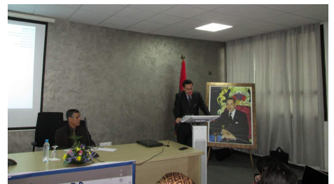
مصطفى الخلفي يلقي محاضرة علمية بجامعة الحسن الثاني بالدار البيضاء